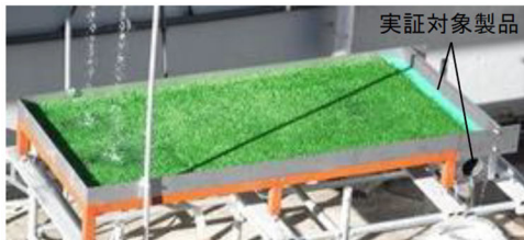
実証対象製品接続時

※気象庁 WEB サイト（予報用語）によると、30mm/h の雨は「激しい雨」、150mm/h の雨は「猛烈な雨」に該当する。