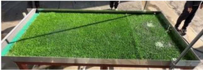
実証対象製品 (降雨量 150mm/h、散水開始から 20 分後)

従来工法に比べて実証対象製品では水溜りの発生が少なかった。このことから、NHドレーンには高い排水性能があると判断されました。水溜りの発生はプレーへの影響が大きいことから、NHドレーンを導入することで、降雨時においてより快適にプレー可能になると考えられます。