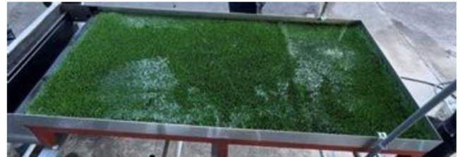
従来工法 (降雨量 30mm/h、散水開始から 20 分後)