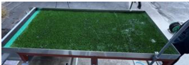
実証対象製品 (降雨量 30mm/h、散水開始から 20 分後)