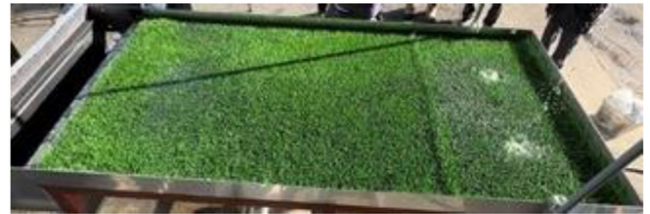
従来工法 (降雨量 150mm/h、散水開始から 20 分後)