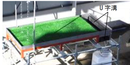
U字溝接続時（従来工法の場合）